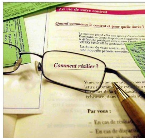
■ C'est au nouvel assureur de faire toutes les démarches auprès de votre ancien agent.